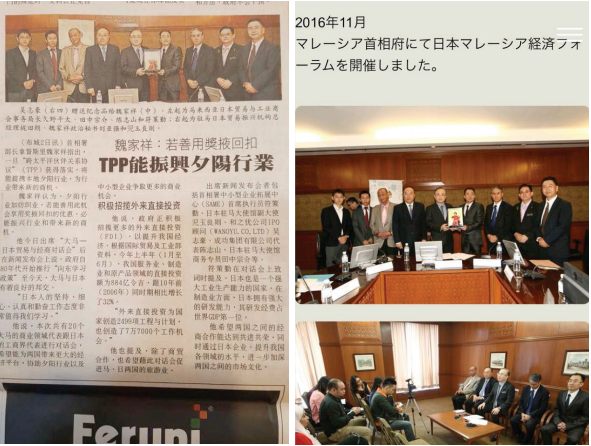
マレーシア メディア

私たちは、国境を越えたビジネスの機会を活用し、新市場に参入し、買収、投資、戦略的連携や適切な戦略的パートナーとの合併事業を通じて投資の機会を模索致しております。