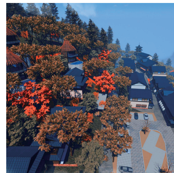
Eco Resort In Naraijuku