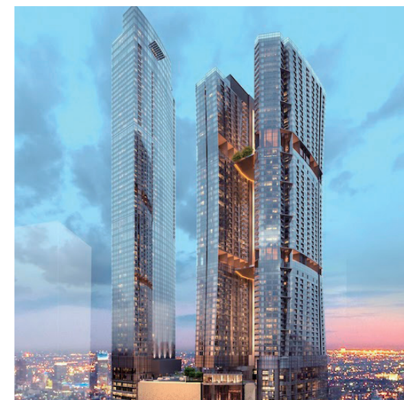
ケンピンスキーレジデンス、マレーシア