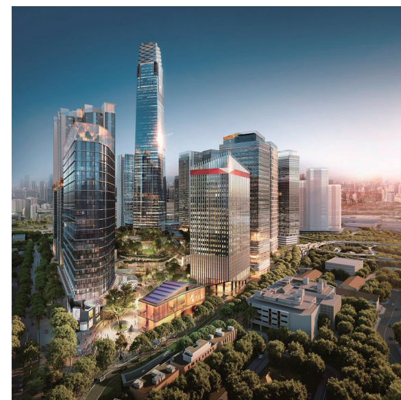
TRXレジデンス、マレーシア

私共は、日本、香港、中国からの不動産投資のために強力な投資家ネットワークを構築しました。マレーシアの不動産市場と不動産市場における外国直接投資（FDI）を専門と致しております。