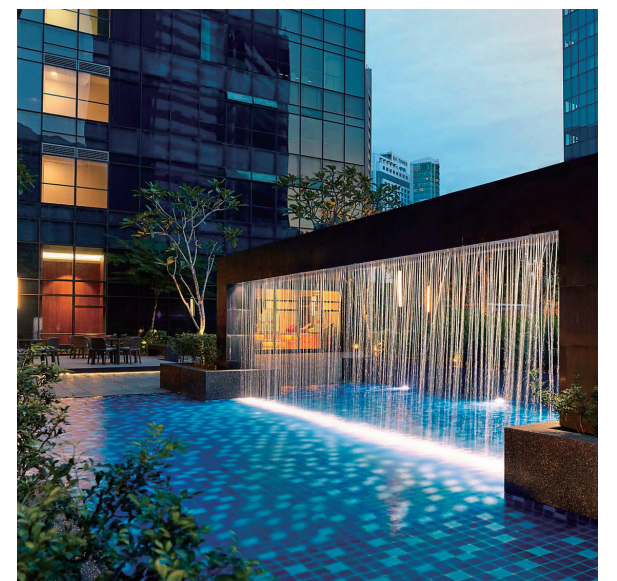
Ritz Carlton Residence