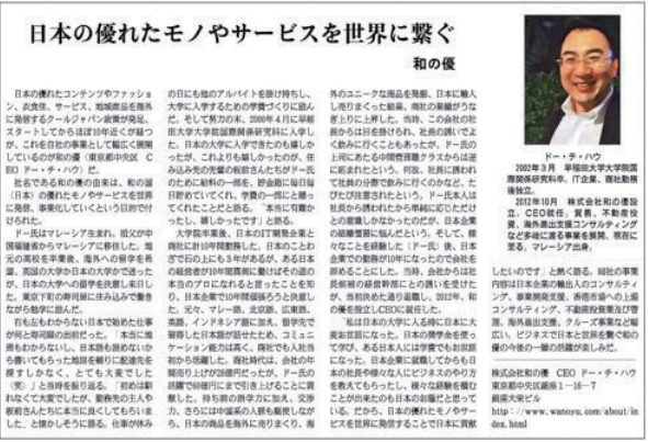
フジサンケイ ビジネスアイ, 日本