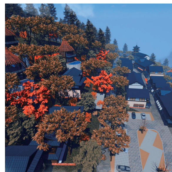
エコリゾート奈良井宿

私たちは、海外投資家のために健康医療、レジャーならびにオフショアでの事業支援を行っております。また、海外投資家のために国際的な投資機会や現地の文化を紹介する現地ガイド役やビジネスコンサルタントとして事業を促進致しております。